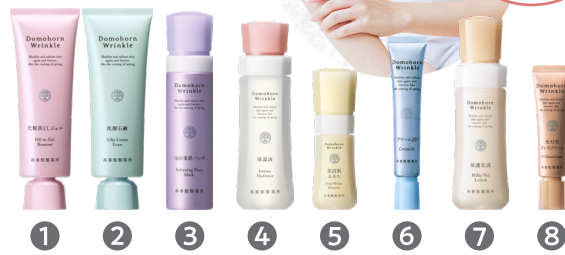
各製品には番号がついています。