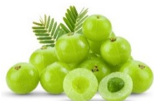
アムラ果実エキス

冷えにより低下した手の末梢血流を上昇させ、手の表面温度(末梢体温)を回復させる機能が報告されています。