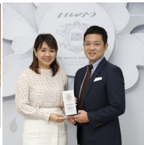
2020年11月12日開催 受賞式の様子

認知度ゼロからスタートしたタイ事業も、お客様、社員、協力会社様や応援して下さった皆様のおかげでこのような賞をいただけるようになりました。こだわりぬいたシワシミ特化の商品開発、安心安全なモノづくり、日本品質を維持した物流と商品管理、ドモホルンリンクルと肌悩みを抱えるお客様を結びつける広告・広報活動、ホスピタリティ溢れる対応・サービスの提供、それを支える事業管理やインフラの整備など。そのどれも欠けては成り立ちませんし、それらが一貫通貫していることが我々の強みであり、お客様に選ばれ続け、なくてはならない会社になるために必要な要素だと考えています。受賞をきっかけにドモホルンリンクルへの理解・共感・納得が高まり、更なるお客様満足が実現できることを願っています。