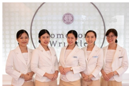
バンコク市内の大型モールにある「セントラルラプラオ店」

再春館製薬所は、このタイの肌環境や人々の志向に着目し、日本で長年提供してきた基礎化粧品「ドモホルンリンクル」とその場しのぎではなく、じっくりとお肌を健やかにしていく「お手当て」という考え方を通して、年齢を重ねてお肌に悩みを抱えているタイの方のお肌悩み改善に少しでも寄与していきたいという思いからタイでの販売開始に至りました。