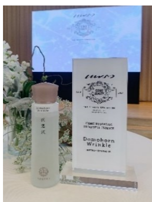
日本のロングセラーがタイの女性にも評価されての受賞

再春館製薬所は、今後も世界中で生涯手放せないと考えていただけるような、より良い製品とサービスを提供できるよう日々努めてまいります。