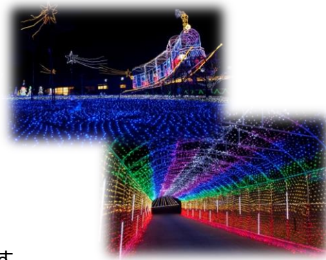
銀河鉄道の世界（写真上）／光のトンネル（写真下）

地元熊本へ元気を届ける活動は、終わることはありません。熊本の陸の玄関口、空の玄関口を桜でいっぱいこしたり、今後はバドミントンなどのスポーツや地域イベント、文化を通じた新しい形での応援で、「熊本になくてはならない会社」として、喜びと元気を提供し続ける取り組みを考えていきたいと思っております。