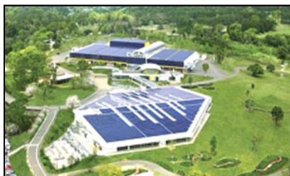
写真上が「薬彩工園」、下が「つむぎ商館」

日本最大級を誇るワンフロアの本社・コールセンターの広さは1,200坪。3本の柱以外に部署を区切る壁は1枚もありません。全国のお客様からのご注文やお問合せは、すべてこのコールセンターで受付し、500回線の電話から発せられる会話は1日に7,000件を超えるほど。独自開発のコールセンターシステムや研究開発部など、すべての部署が一堂に会し、社員約1,000人が働く、再春館製薬所の心臓部です。