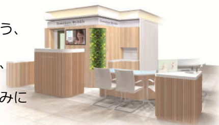
「ドモホルンリンクル 阪急うめだ本店」 リニューアルイメージ

リニューアル後の空間コンセプトは「自然の力」。 もともと漢方の製薬会社である弊社イメージを想起していただけるよう、店舗中央には鮮やかな色が目を引く草花をあしらいました。 またお客様に、より自然の力をイメージしていただくことを意図し、ドモホルンリンクルの原料となる生薬の展示スペースを拡大しました。 改装後も製品のラインナップは変わらず、お客様一人ひとりのお悩みに合わせたサービスを提供し、さらに多くのお客様とのお縁やご満足をつないでいくスペースになれるよう、努めてまいります。