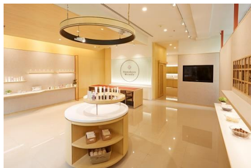
バンコクにオープンする「Domohorn Wrinkle Experience Space」 全商品を実際に見て・触れて・使って頂くことができます。

また、商品を知っていただくためのドモホルンリンクルコミュニケーションの拠点として、タイ(バンコク)にどなたでも気軽に利用できる「Domohorn Wrinkle Experience Space」をオープンいたします。