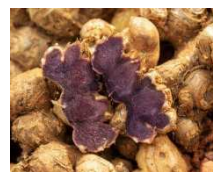
ブラックジンジャー

毎日続けやすく、高齢者でも飲み込みやすいように、ゼリーでの商品化を実現。1本20gのスティックタイプのゼリーに厳選成分をギュッと凝縮。水なしでも食べられる上、持ち運びにも便利です。